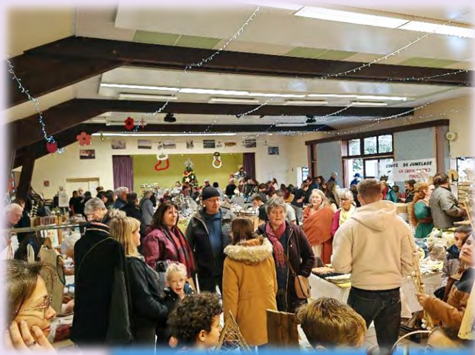
Illuminations et marché de Noël