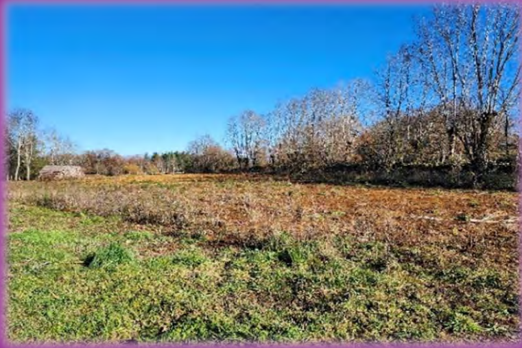
Coupe des arbres à La Fage