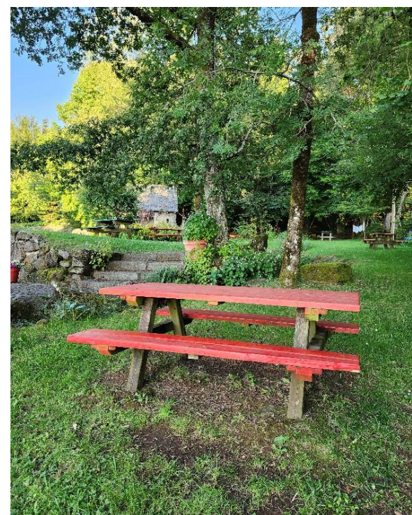
Etang de la Fage